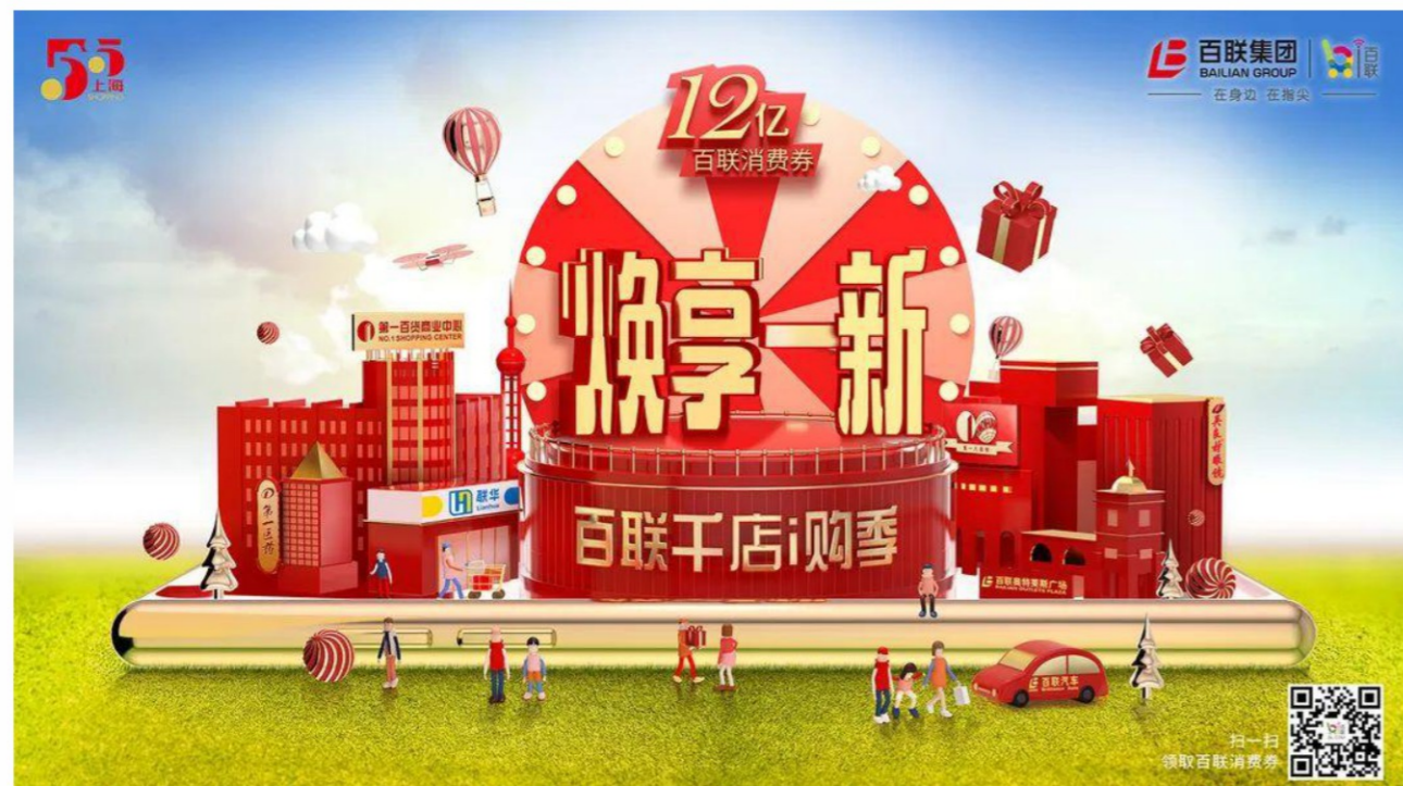
焕享一新·百联千店i购季

上海在全国首创开展大规模综合性消费节庆活动——“五五购物节·全城打折季”促消费营销活动。百联集团率先推出“焕享一新·百联千店i购季”，组织开展了全业态、全品类、全渠道的系列营销活动，实现全域GMV141亿元，新增百联通会员102万，线上线下载流/UV合计约1.23亿人次，发券12亿元；整合营销活动全网曝光7.3亿人次，直播观看465万人次。