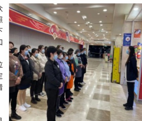
百联南方购物中心进行晨会宣贯

百联旗下商场、超市都是容易聚集人流的公共场所，集团始终把人民群众的生命健康放在第一位，在市商务委、市经信委和有关行业协会指导下，按照“三个全覆盖”“三个一律”和“三个强化”的防控工作要求，针对集团旗下不同业态制定和实施复工复产防疫工作指引和营业指南，完善各类应急预案和工作措施，所有经营场所做到“测体温”“戴口罩”“勤消毒”。对于手推车、购物篮、自动扶梯、收银线等客用设施进行“定时定人、井然有序”的全方位消毒，在有条件的场所提供洗手处，放置洗手液、消毒液等卫生用品，按规定停用中央空调系统，保持良好的通风条件，并对人员密集区域采取适当限流措施，提示到店消费者保持适当距离，竭力为消费者提供卫生安全的购物环境。同时，加快超商门店的新零售系统建设，通过运用扫码购、自助支付等技术，尽可能减少人员接触，降低风险。如位于疫情重灾区的武汉奥特莱斯，自1月23日武汉发布1号通告后，克服交通停运、物资缺乏、人员紧张等困难阻碍，第一时间暂停营业，加强有效防护措施，仅有3名厂方员工确诊。