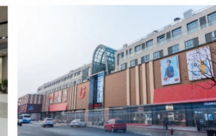
百联临港生活中心

百联集团将持续积极参与新片区的发展，与临港新片区管委会积极对接，力求在新片区有所作为。