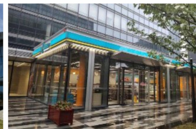
逸刻临港陆家嘴门店

其中：联华新竹柏店每天服务1200多户居民，预计年接待顾客15万多人次；逸刻临港陆家嘴门店涵盖早中晚餐和下午茶场景同时支持“网订店取”、自助收银等新零售升级体验。